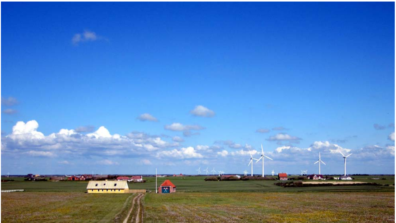
Fjaltring & Trans - Et godt sted at bo - Et godt sted at holde ferie