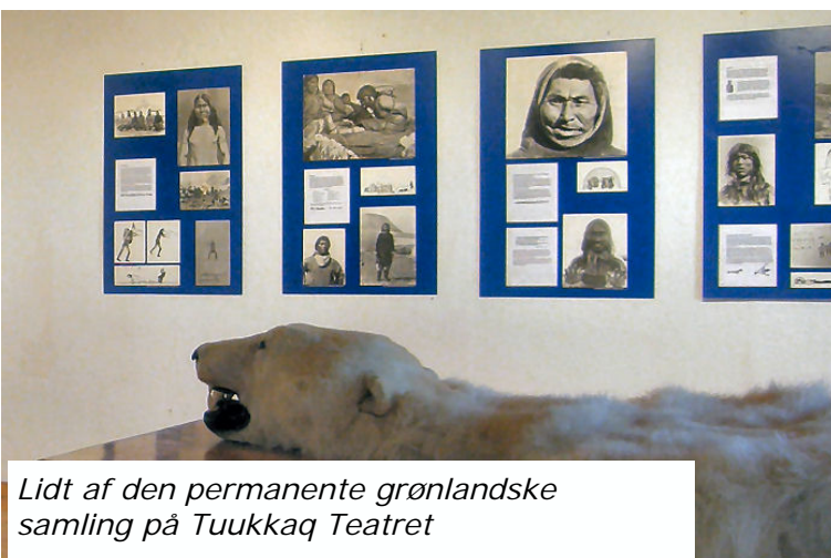
Lidt af den permanente grønlandske samling på Tuukkaq Teatret

Derudover afholdes koncerter, gæstespil og udstillinger.