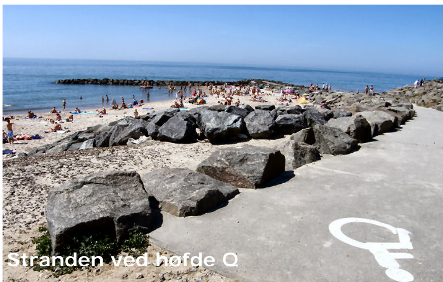
Stranden ved hofde Q

Området ved hofde Q er blevet et vigtigt samlingssted for egnen.